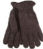
PAR DE LUVAS