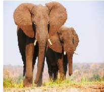
CASAL DE ELEFANTES