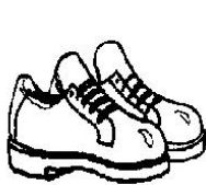
PAR DE TENIS

4. Casal, uma dupla, um par. Usamos essas palavras para determinar um conjunto de dois elementos. Por exemplo: