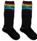
PAR DE MEIAS