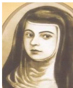
SOROR JOANA ANGÉLICA