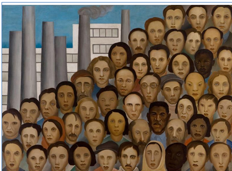
“OPERÁRIOS” de Tarsila do Amaral (1933)

VOCÊ JÁ VIU ESTA IMAGEM EM ALGUM LUGAR? ESTA É UMA OBRA DE TARSILA DO AMARAL QUE RECEBE O NOME DE “OPERÁRIOS”.